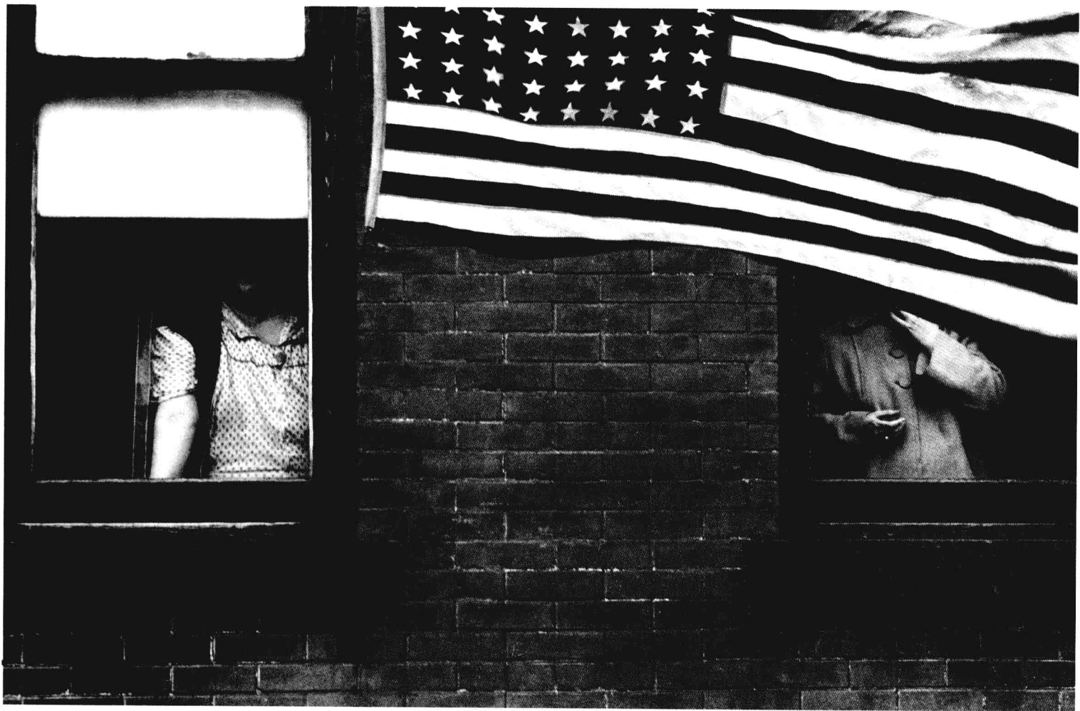
左图：《父与子》，罗伯特·舒兹/摄，奥蒂斯空军基地，1963。美联社