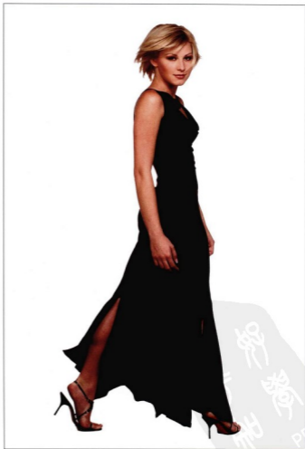
▲ 掌握给模特摆姿势的技巧，唯一的方法是学习和实践。

如果为商业客户创作图片，模特常常没有产品重要；她仅仅被用来增加照片的意境。既然如此，